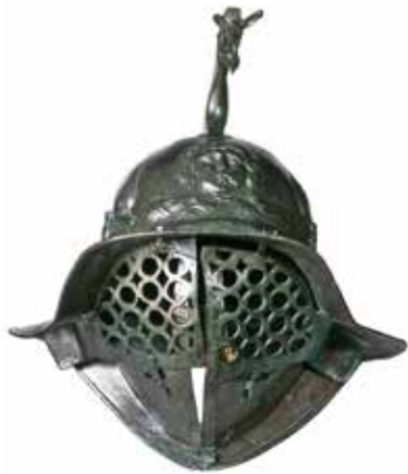
Casque de Thrace École de gladiateurs de Pompéi, Italie. 50-79 ap. J.-C. Bronze - Musée archéologique national de Naples, Italie