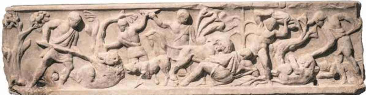
Chasse dans l'arène, Rome, Italie. II e siècle ap. J.-C. Marbre – Musée du Palatin, Rome, Italie

Pour reconnaître la défaite, un gladiateur devait poser son bouclier à terre et lever son index pour demander pitié. La foule exprimait son jugement à travers des cris et des mouvements du pouce et c'est à l'empereur que revenait la décision de vie ou de mort. Si aucune clémence n'était accordée, le gladiateur devait accepter sa mort avec dignité de la main de son adversaire. Le vainqueur recevait alors ses prix, une branche de palme et la possibilité d'engager une prochaine fois un nouveau combat. S'il survivait assez longtemps, il pouvait gagner la liberté, la célébrité et parfois la fortune.