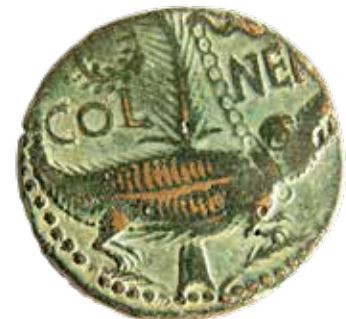
As de Nîmes / revers : crocodile enchaîné à une palme ; COL NEM. Monnaie émise à Nîmes sous le règne d'Auguste (27 av. J.-C. / 14 ap. J.-C.)

La fameuse monnaie appelée l'as de Nîmes bénéficie d'une vitrine spécifique. Un écran circulaire en vis-à-vis en raconte l'histoire et les anecdotes associées, jusqu'à son utilisation comme emblème de la ville.