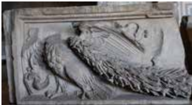
Frise des aigles, I er siècle ap. J.-C., marbre

Cet espace du musée, ouvert sur la place des Arènes, permet de confronter la cité d'aujourd'hui et les représentations historiques qui ont traversé les âges. Ce va-et-vient s'illustre aussi par un dispositif de réalité augmentée soulignant la proximité entre l'enceinte augustéenne et les Arènes à l'époque romaine. Des maquettes des monuments disparus, de ceux sauvegardés et de la ville romaine sont associées à des dispositifs multimédia interactifs qui donnent la possibilité de les découvrir dans leur forme et leur contexte originel et, pour certains, d'être comparés à d'autres édifices connus du monde romain. L'évocation des bâtiments publics et de l'architecture privée mettent les visiteurs en situation dans le monde romain.