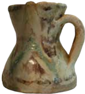
Pichet vert et brun, XIV e siècle