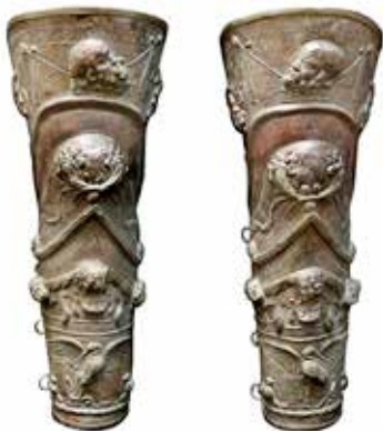
Jambières en bronze École de gladiateurs de Pompéi, Italie. 50-79 ap. J.-C. Bronze - Musée archéologique national de Naples, Italie