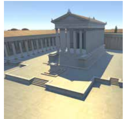
Modélisation 3D de la Maison Carrée

Que ce soient les dispositifs de réalité augmentée, les panoramiques interactifs à 180° ou encore le mur d'images interactif (dispositif scénographique unique et innovant), tout est fait pour projeter les visiteurs dans le passé, afin de leur faire découvrir la vie des hommes dans l'Antiquité, l'évolution de leurs savoir-faire et les chefs-d'œuvre qu'ils ont produits.