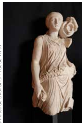
Nymphe en calcaire local, découverte en 1958 route de Beaucaire, I er siècle ap. J.-C.