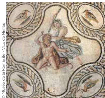
© Musée de la Romanité - Ville de Nîmes