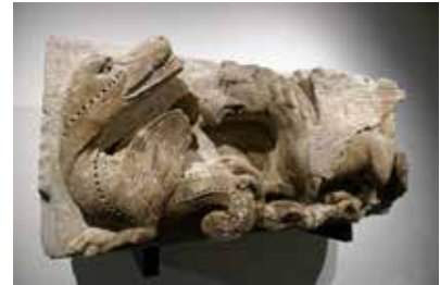
Combat des monstres, époque romane

L'époque romane est mise en valeur par des sculptures en ronde bosse (fragment de statue masculine, peut-être Hérode, têtes humaines et animales), en relief (combat entre deux monstres, deux vieillards de l'Apocalypse...), ainsi que par la collection de chapiteaux et d'ornements que possède le musée. Ils sont posés sur des colonnes de différentes dimensions. En décor de fond, sur la paroi en double hauteur, on découvre les restitutions graphiques des façades d'une maison romane et d'une maison du XV e siècle.