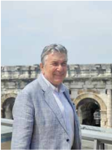
© Dominique Marck - Ville de Nîmes