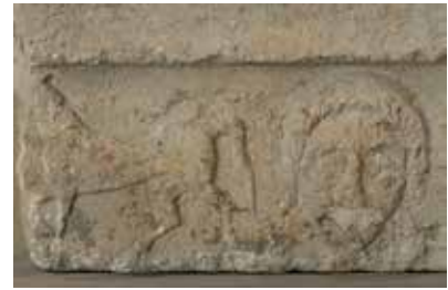
Linteau de nages, fin III e -II e siècle av. J.-C., calcaire

30 hectares, cerné d'une enceinte dominée par une puissante tour de guet qui servira de base à la future Tour Magne. L'agglomération joue sans doute, dès cette époque, un rôle économique important. La plaine est jalonnée de nombreuses routes et chemins desservant un réseau de fermes et d'enclos funéraires et conduisant aux autres oppida et comptoirs commerciaux de la région. De tels lieux ont permis la rencontre des peuples, comme en témoigne par exemple l'écriture gallo-grecque, très bien représentée dans les collections épigraphiques du musée.