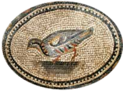
Mosaïque de Penthée / détail : oiseau. Fouille du parking Jean-Jaurès 2006- 2007. I er siècle ap. J.-C.

Augusta Nemausus. Deux lieux voués au culte impérial sont fondés dès la période augustéenne : un sanctuaire dynastique (appelé Augusteum) sur le site de la Fontaine et un temple érigé au sud du forum, la Maison Carrée.