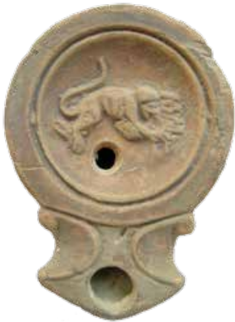
Lampe à huile en terre cuite ornée d'un motif figurant un singe. Nîmes, époque romaine