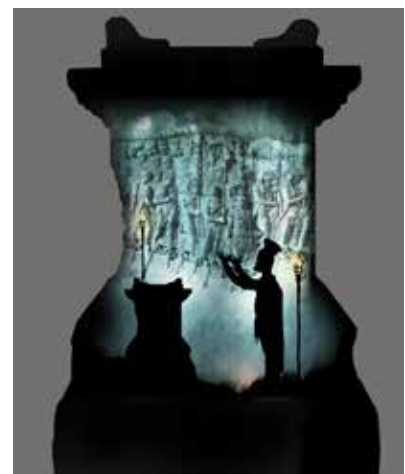
Projection sur un autel votif