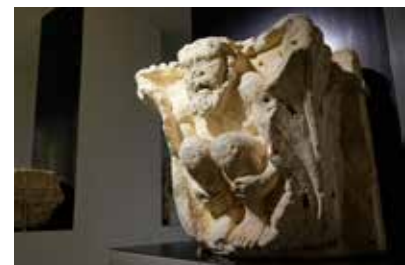
Chapiteau avec atlante entre deux feuilles d'acanthé. Mitieu du XII e siècle