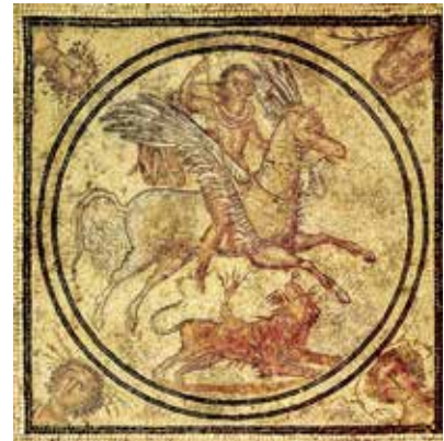
Mosaïque de Bellérophon / panneau central : Bellérophon chevauchant Pégase en train de tuer la Chimère. Époque romaine. Fin II e – début III e siècle ap. J.-C.

La superbe mosaïque sur le thème de Bellérophon fait l'objet d'un traitement particulier. Disposée sur le toit du tunnel d'une séquence suivante sur « le culte des divinités », elle est propice à une pause contemplative avant de poursuivre la visite en descendant de la mezzanine. Mise au jour en 1950 à l'occasion de travaux effectués boulevard Gambetta, cette mosaïque immortalise, sur son panneau central réalisé à partir de petits cubes de marbre, une célèbre scène de la mythologie : le combat de Bellérophon et de la Chimère. Sa taille – près de 14 m 2 –, son décor, la technique utilisée et son état de conservation en font également une pièce exceptionnelle.