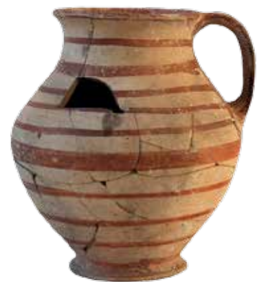
Céramique de la maison de Gailhan, V e siècle av. J.-C., calcaire

Bel exemple de l'apport des nouvelles technologies à la perception et à la compréhension des vestiges anciens, un procédé de réalité suggérée offre la possibilité de matérialiser l'espace de vie, tandis que des dispositifs multimédia interactifs offrent aux visiteurs une immersion dans la vie quotidienne des Gaulois.