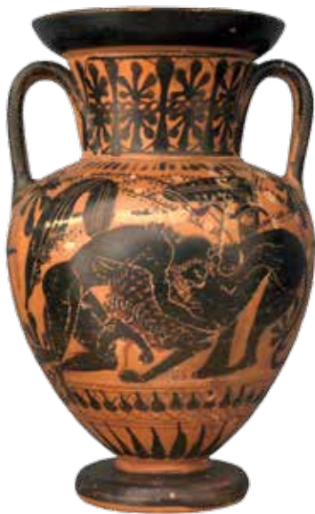
Amphore à figures noires : Héraclès et le lion de Némée. Grèce. Début V e siècle av. J.-C.