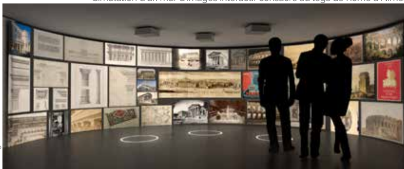
Simulation d'un mur d'images interactif consacré au legs de Rome à Nîmes

À la disposition des visiteurs, des boîtes blanches lumineuses, appelées « boîtes du savoir », ouvrent les trois sections chronologiques du parcours. Il s'agit d'un procédé créé par Elizabeth de Portzamparc pour servir d'introduction aux différentes séquences : des cartes, des frises chronologiques, des écrans présentent et contextualisent la période considérée.