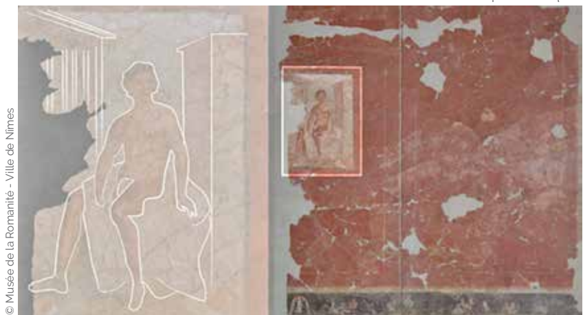
Reconstitution des décors peints antiques

Une pièce à vivre est reconstituée, respectant le volume de l'époque, étroit et haut sous plafond. L'une des parois est ornée d'une peinture décorative significative, dont les éléments manquants sont restitués par projection.