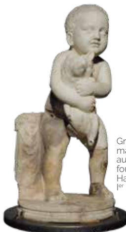
Groupe sculpté en marbre dit « L'enfant au chien ». Nîmes, fouille de la ZAC des Halles, 1989-90. I er siècle ap. J.-C.