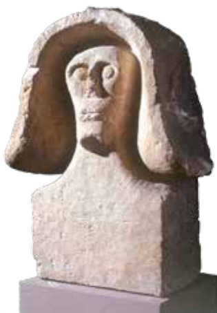
Buste de statue masculine en calcaire. Sainte-Anastasie (Gard), 1927. Premier Âge du Fer.

La politique de domination romaine est montrée dès ses débuts par une sorte de couloir temporel qui matérialise au sol les traces d'une voie romaine. Dans une ambiance sonore spécifique, les visiteurs sont invités à découvrir les inscriptions en gallo-grec (dédicaces ou épitaphes), des tombes des II e et I er siècles av. J.-C., les premières monnaies, ainsi qu'une borne « géographique » énumérant les agglomérations sous l'autorité nimoise à cette époque .