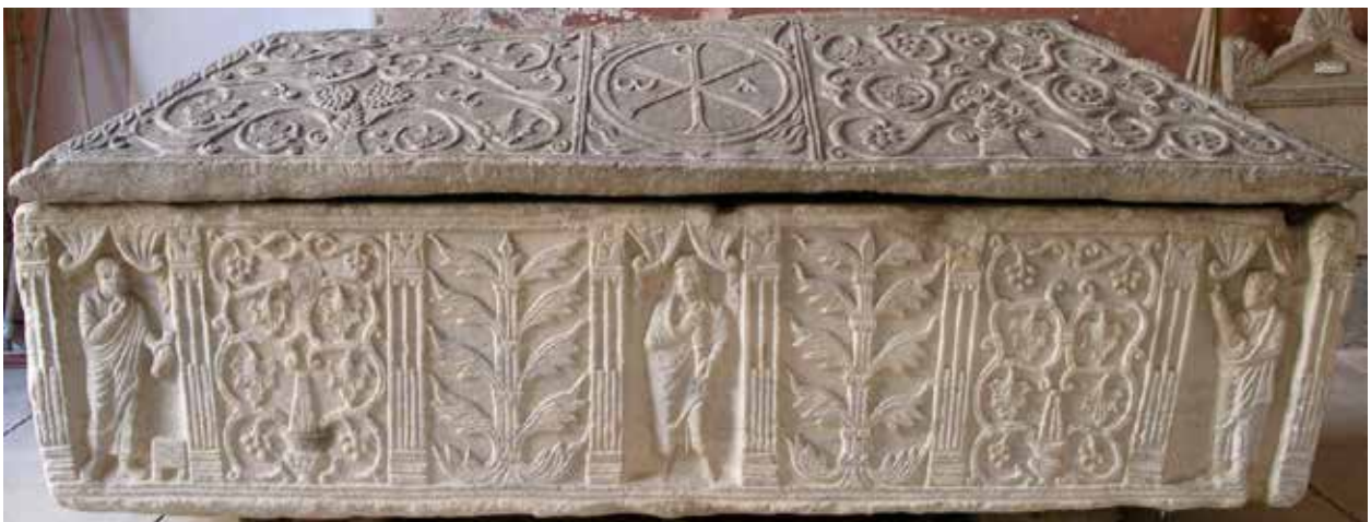
© Musée de la Romanité - Ville de Nîmes

Située au niveau de l'entresol, cette transition est le trait d'union entre la période romaine et le Moyen Âge. Les visiteurs sont accueillis par le sarcophage de Valbonne, installé en majesté, un chapiteau aux décors mixtes, exemplaire d'un mélange de styles dû à des influences variées ou encore par des textes et gravures illustrant la légende de saint Baudile, un homme qui, cherchant à évangéliser Nîmes, a eu la tête coupée par les Romains. Celle-ci aurait rebondi trois fois, faisant surgir une source à chaque impact !